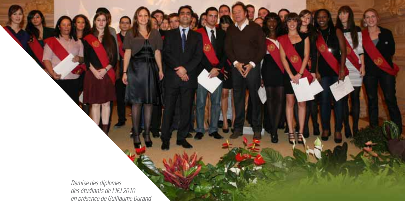
Remise des diplômes des étudiants de l'IEJ 2010 en présence de Guillaume Durand