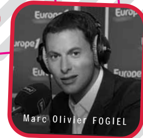
Marc Olivier FOGIEL