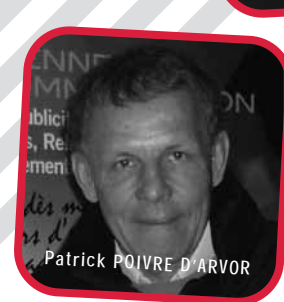
Patrick POIVRE D'ARVOR